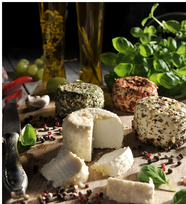
Archiwum Jurajskiego Koziółka