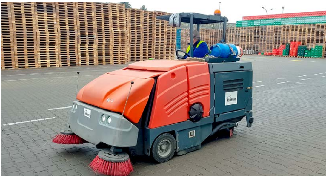
Wsparcie pozwoli firmie na zakup innowacyjnego środka transportu do wywozu odpadów.

Koszt projektu „Podniesienie konkurencyjności przedsiębiorstwa oraz wzrost zatrudnienia poprzez zakup specjalistycznego środka transportu (śmieciarki) służącego do zbiórki odpadów komunalnych oraz ich wywozu na miejsce składowania i/lub utylizacji” to kwota niemal 1 mln zł, z czego unijne dofinansowanie wyniosło ponad 660 tys. zł.