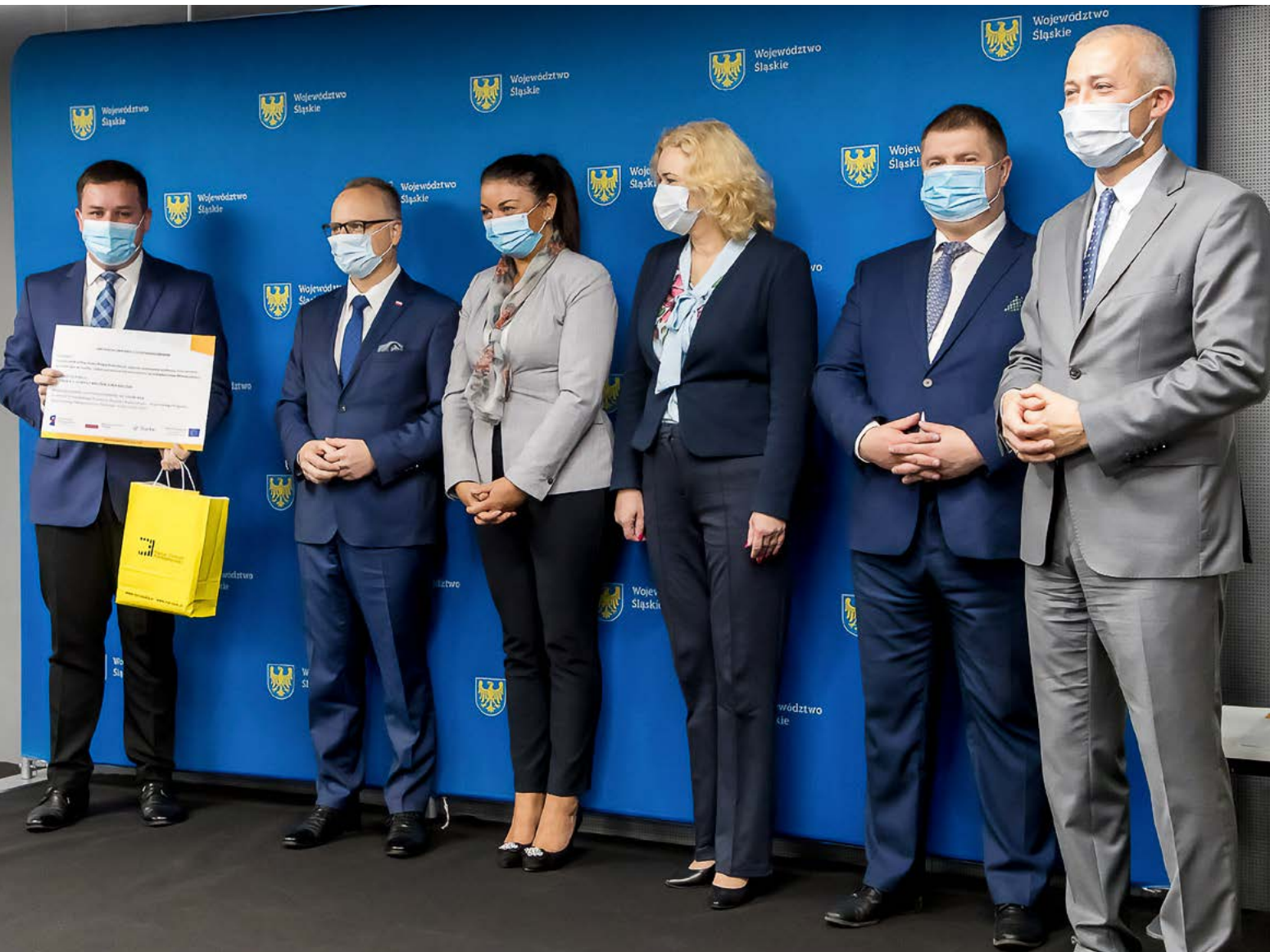
Dotacje przyznawane w konkursach ŚCP to szansa na rozwój i podniesienie konkurencyjności.