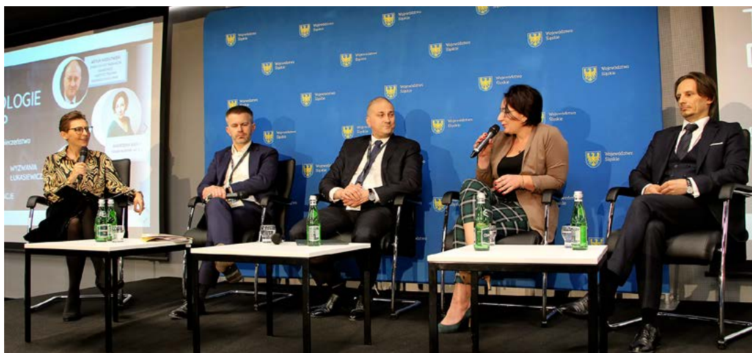
O poszukiwaniu innowacji dyskutowali przedstawiciele Polskiego Klastra IoT & AI, Instytutu Technik Innowacyjnych EMAG oraz Sieci Badawczej Łukasiewicz.

Kreowanie nowatorskich rozwiązań nie będzie jednak możliwe, jeśli firmy nie będą dysponowały wysokiej klasy specjalistami, dlatego równie ważne, co inwestowanie w infrastrukturę, jest wspieranie pracowników.