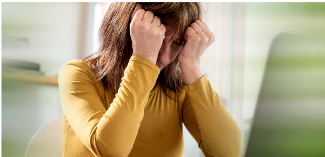
W Polsce na depresję choruje 1,5 mln osób.

– System Psycho_Log, bo tak brzmi jego nazwa, będzie wspomagał diagnozę i monitorowanie leczenia w zaburzeniach zdrowia psychicznego – mówi Waluś. – Pozwoli na zdalny kontakt lekarza z pacjentem i ułatwi pracę.