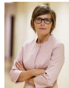
Autorka tekstu Paulina Cius-Górska Zespół ds. kontaktów z mediami