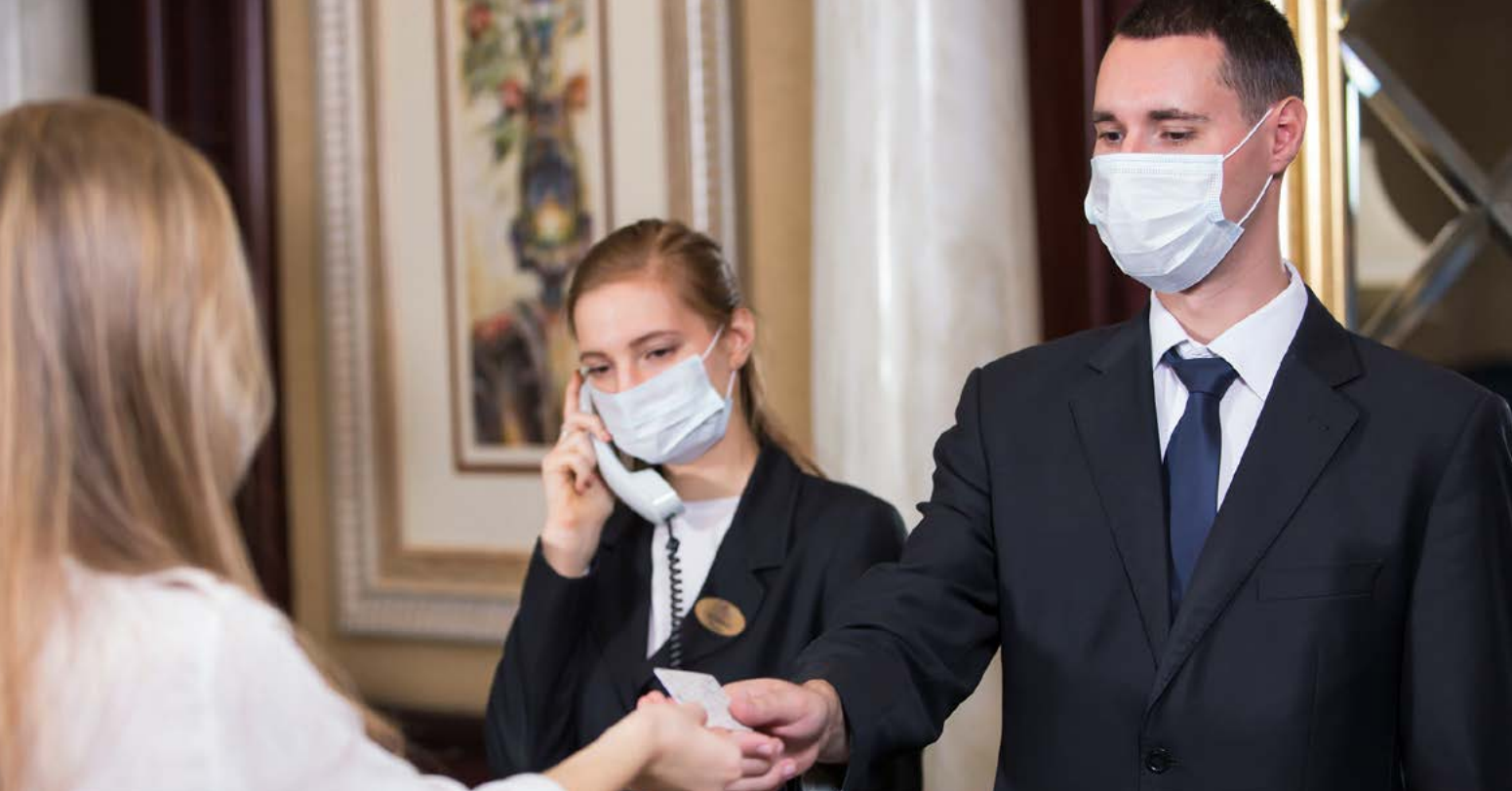
Branża hotelowa silnie odczuła skutki pandemii.

W trwającym od 30 kwietnia do 20 maja naborze dotację mogły uzyskać przedsiębiorstwa spełniające dwa warunki – posiadające kod PKD działalności związany z turystyką lub gastronomią (regulamin konkursu wskazywał 17 takich kodów) oraz wykazujące min. 50% spadku przychodów w 2020 roku. Maksymalna kwota dofinansowania przewidziana w tym naborze wyniosła 500 tys. złotych, minimalna 50 tys. złotych, natomiast zakres pomocy sięgał 85% kosztów kwalifikowalnych. Dotację można przeznaczyć m.in. na: nakłady na inwestycje przyczyniające się do rozbudowy posiadanych aktywów niezbędnych do utrzymania działalności, podniesienia atrakcyjności oferowanych usług oraz przeprowadzenie prac modernizacyjnych podwyższających standardy bazy noclegowej czy gastronomicznej.