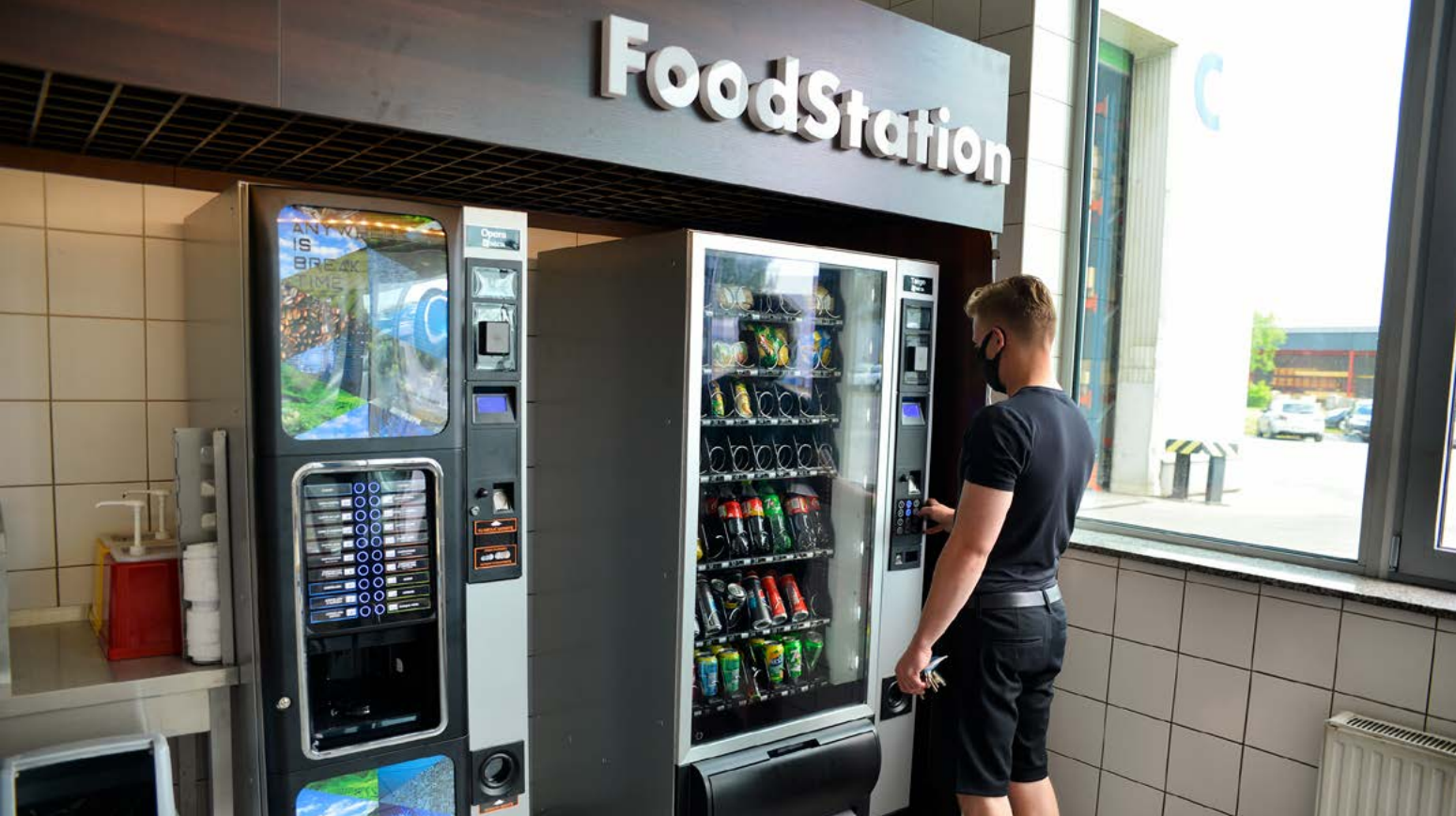
Instalacja w jednym z gliwickich przedsiębiorstw.