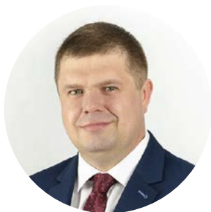
Wojciech Kałuża Wicemarszałek Województwa Śląskiego