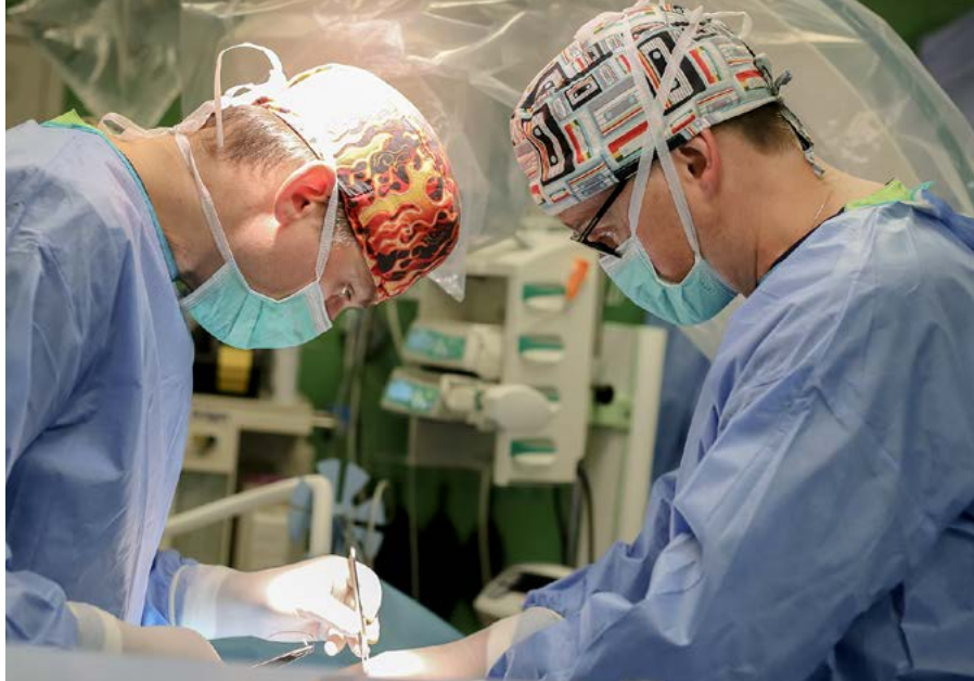
Lekarze kliniki Polvet podczas zabiegu.

Poszukiwanie nowych technologii to od lat cel mikołowskiej Kliniki Weterynaryjnej Polvet, która w ramach Działania 1.2. realizuje projekt „Prace badawczo-rozwojowe nad innowacyjnymi rozwiązaniami w zakresie implantologii”. Wartość przedsięwzięcia to ponad 8,6 mln złotych, z czego dofinansowanie RPO WSL wynosi ok 5,9 mln zł.