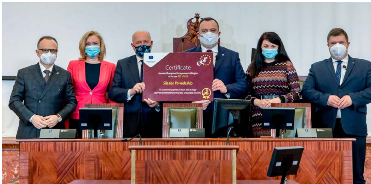
Nagroda została wręczona podczas sesji plenarnej Komitetu Regionów.

Komitet Regionów wyróżnił nasze województwo nagrodą za najlepszą strategię wspierania przedsiębiorczości w okresie walki z pandemią. Nagroda „Europejski Region Przedsiębiorczości” została przyznana sześciu regionom, a jego laureatów uhonorowano marką ERP na okres dwóch lat (2021 i 2022), co umożliwi im zaplanowanie i wdrożenie strategii udanej odbudowy gospodarczej i społecznej.